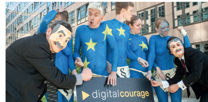
Wir mischen uns ein – mit charmanten und wirksamen Aktionen.

„Je mehr Bürgerinnen und Bürger mit Zivilcourage ein Land hat, desto weniger Helden wird es einmal brauchen.“