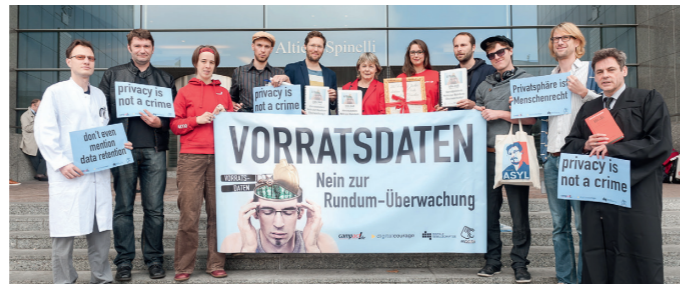
100.000 Unterschriften gegen die Vorratsdatenspeicherung werden in Brüssel übergeben

Wir müssen das Mitschnüffeln technisch und juristisch unmöglich machen. Dafür braucht es eine Politik, die Freiheit statt Machtinteressen in den Mittelpunkt stellt. Bis es so weit ist, müssen wir uns selber schützen. Dieses Falblatt soll ein erster Einstieg sein.