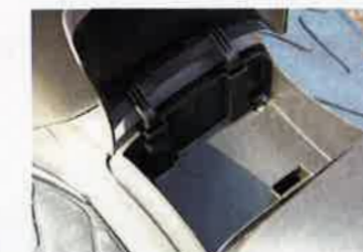
Kleinfach im Mitteltunnel