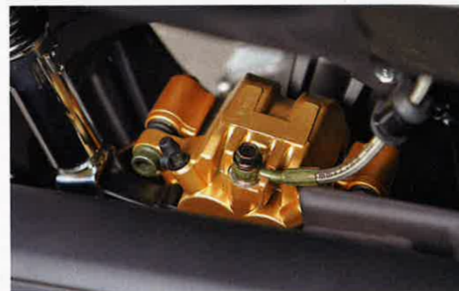
Auch hinten arbeitet eine groß dimensionierte Bremszange