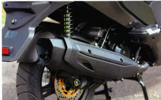
Voluminöser Auspufftopf, gut für die Leistungsausbeute