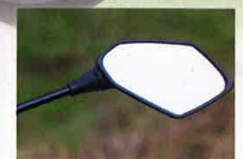
Spiegel etwas klein