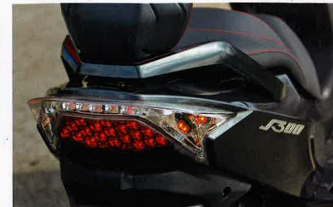
Großflächige Lichtorgel am Heck mit LED-Bestückung