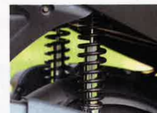
Federung agiert straff