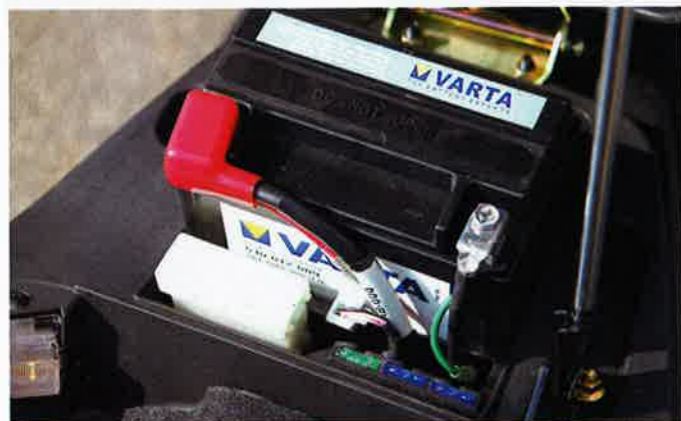
Der wartungsfreie Akku ist gut zugänglich montiert