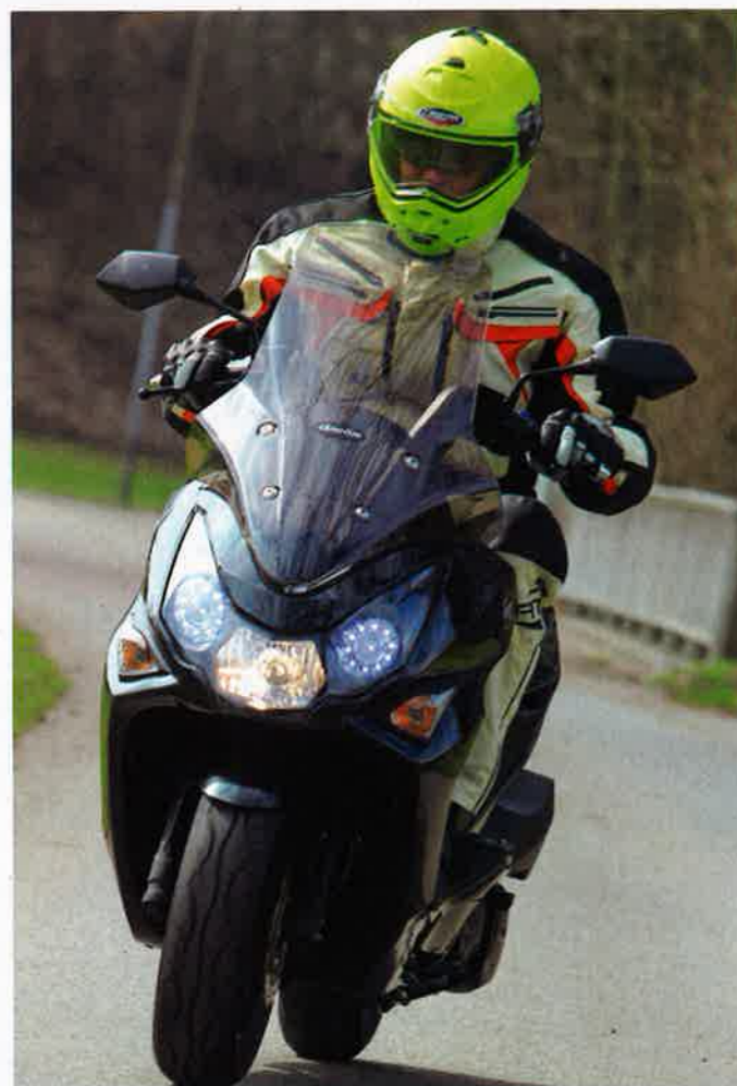
Von vorn dominiert der dreigliedrige Scheinwerfer