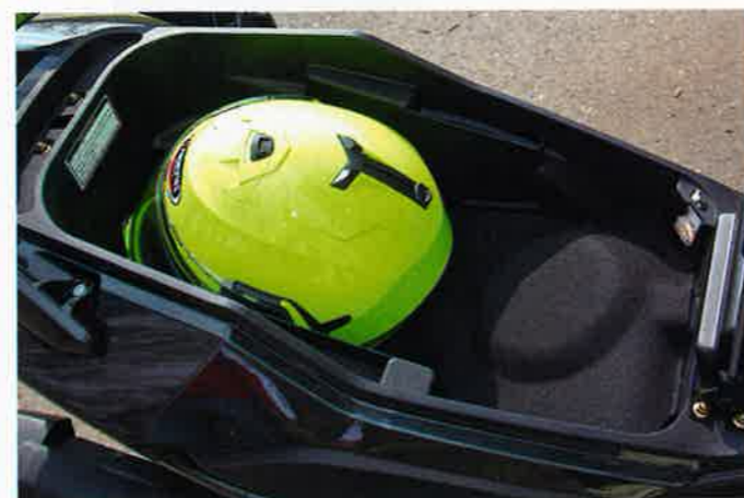
Unter den Sitz paßt weit mehr als ein Integralhelm

Handhabung: Geht wie von selbst und zwar im Sinne des Wortes. Dank keyless-go, also einem Funkschlüssel, muß nur der irisierend blau umleuchtete Zündschalter gedrückt und gedreht werden, schon ist der S 300i scharf geschaltet.