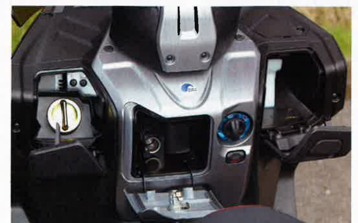
Tankstutzen, Steckdose, Zündschloß, Handschuhfach