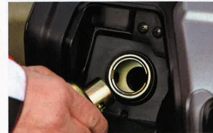
Der üppige, 12,7 l fassende Tank ist gut entlüftet

werdenden Einzeldisziplin für sämtliche Scooter. Schließlich werden die stolzen Besitzer nicht jünger und verzichten gerne auf vermeintlich sportliche Härte. Die kombinierte Bremsanlage hat den S 300i im Griff. Wie schon im 125er genügt der linke Hebel (= vorn & hinten) für drei