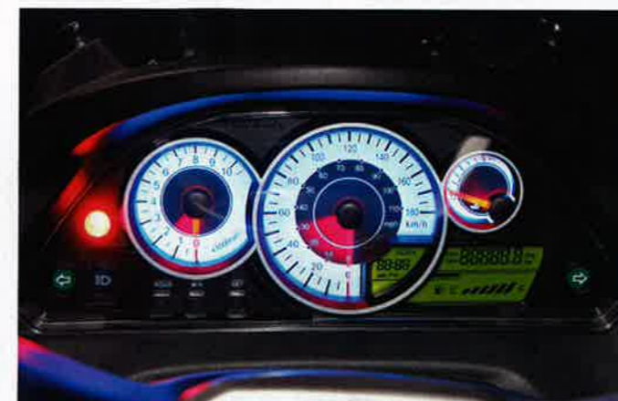
Infofülle im hervorragend abzulesenden Großcockpit