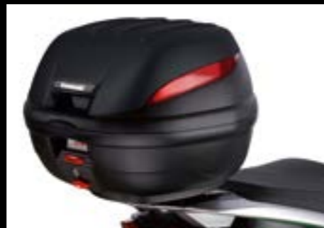
TOPCASE (39 LITER)

Zusätzliche Ladekapazität bietet dieses wetterfeste Topcase* in Fahrzeugfarbe aus dem Zubehörprogramm. Es ist abschließbar und praktisch – ein Muss in der City.