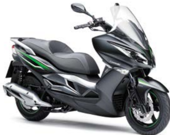
METALLIC FLAT ANTHRACITE BLACK / CANDY FLAT BLAZED GREEN (SCHWARZ / GRÜN)*