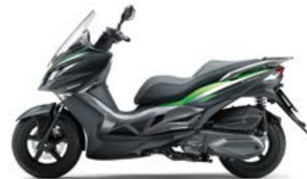
J300 SPECIAL EDITION