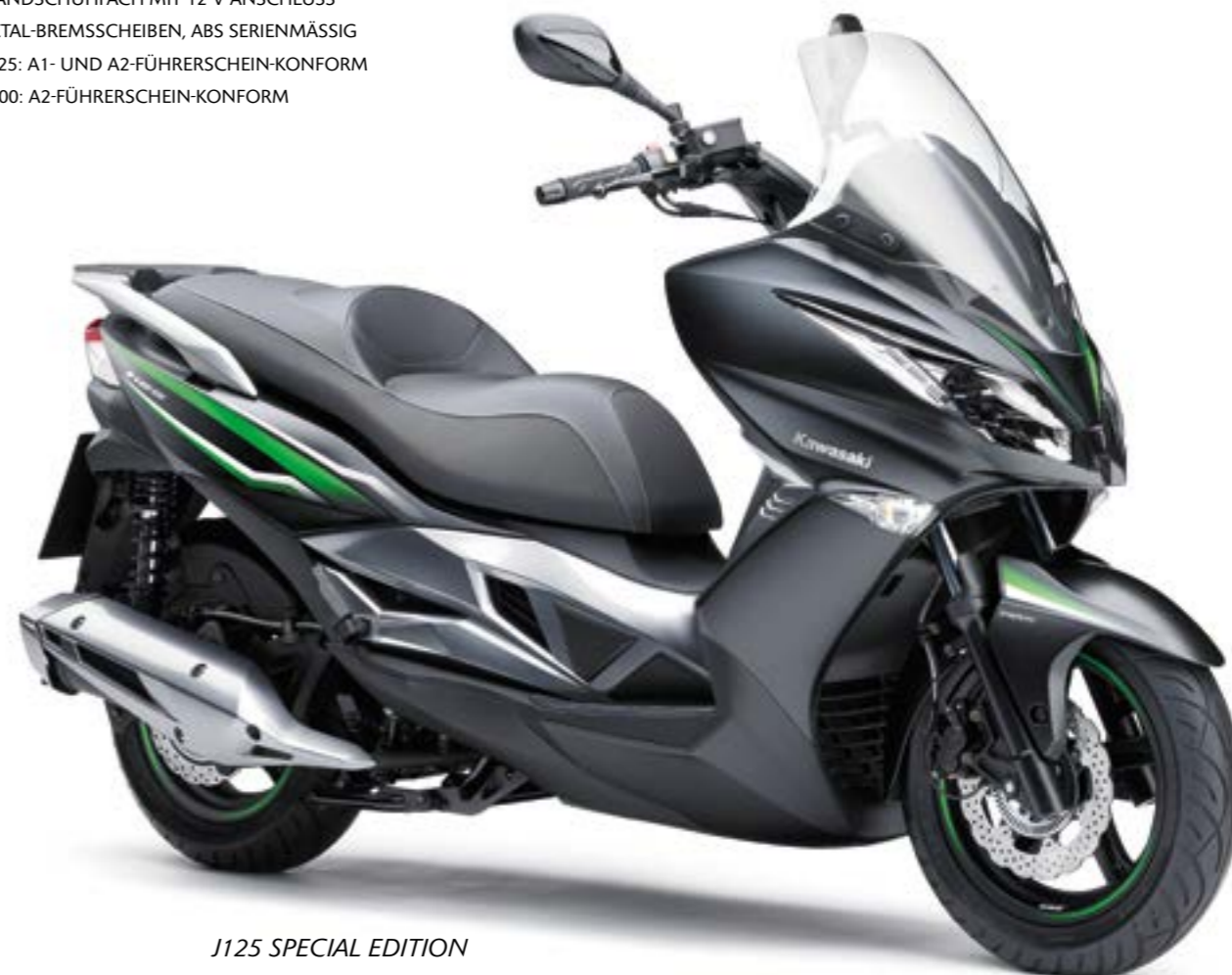
J125 SPECIAL EDITION