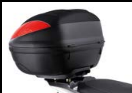
TOPCASE (47 LITER)

Die Detailfotos auf dieser Seite zeigen den J125.