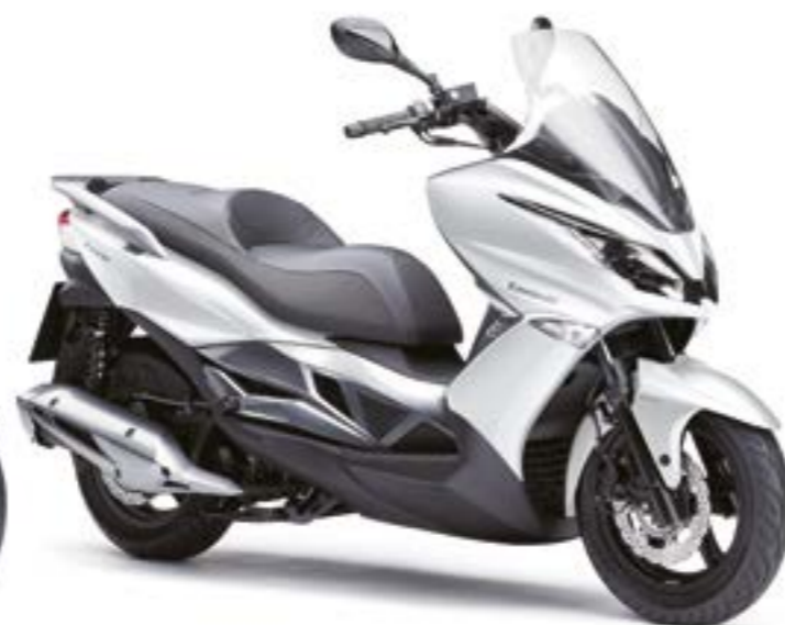
METALLIC FROSTED ICE WHITE (WEISS)