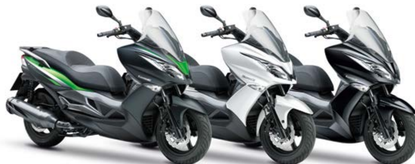
METALLIC FLAT ANTHRACITE BLACK / CANDY FLAT BLAZED GREEN (SCHWARZ / GRÜN)*