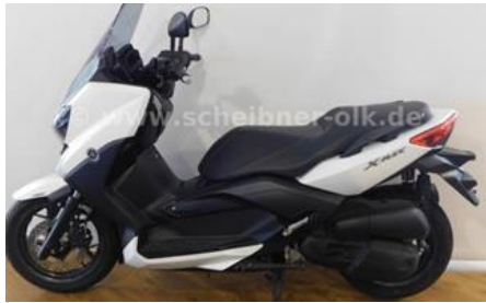
Roller Yamaha X-Max 125