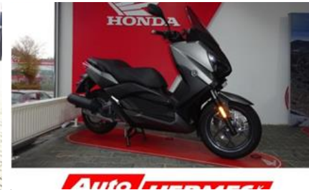
Roller Yamaha X-Max 125

(/gebrauchtes-motorrad-2041813-yamaha-x-max-125)