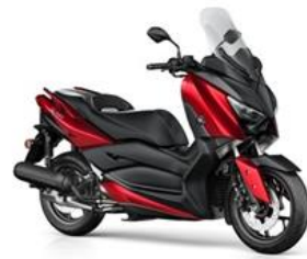
Roller Yamaha X-Max 125