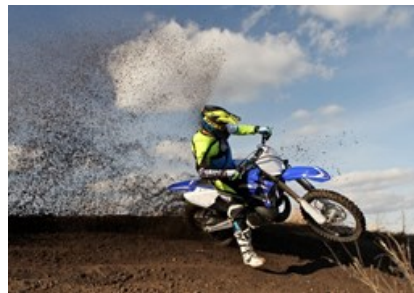
Testbericht Yamaha YZ 125 & 250 2018 (/testbericht-3003540-testbericht-yamaha-yz-125-und-250-2018)