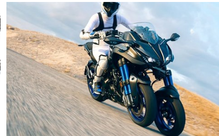
Öhlins FAHRWERKSKOMPONENTEN FÜR YAMAHA T-MAX 530 (2017)

(/modellnews-3003792-das-neue-yamaha-niken-2018)