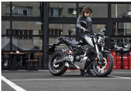
Honda CB125R Nakedbike (/modellnews-3003829-honda-cb125r-nakedbike)