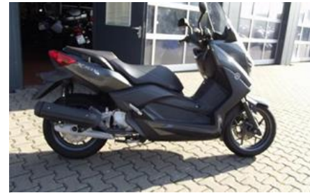
Roller Yamaha X-Max 125

fahrzeugId=1849790&frontend=TausendPS_AT) (/AnfragenSnippet/GebrauchteAnfrage?